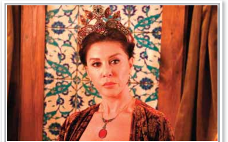
«Möhəşəm əsr» filmində Valide Sultan obrazını canlandıran məşhur türk aktrisası

Yuxarıdan aşağı: 1.Naxçıvan Muxtar Respublikasının Şahbuz rayonunda kənd; 2.«Haziran gecəsi» filmində Kumru, «Möhəşəm əsr» filmində Valide Sultan obrazlarını canlandıran məşhur Türkiyə aktrisasının adı; 3.Turin vilayətində şəhər; 4.Quba rayonunun inzibati ərazi vahidində kənd; 5.Qaçış, velosiped yürüşü və qaçış mərhələlərindən ibarət idman növü; 6.Mizrabla çalınan simli musiqi aləti; 7.İri dəniz məməlisi; 13.Hind okeanının şərqi hissəsində yerləşən İndoneziya adası; 15.Polşanın paytaxtı; 16.Hərbi yük qatarı; 17.Qarabağ tipinə aid olan xovlu xalça növü; 18.Rusiyanın Saxa və Maqadan vilayəti ərazisində axan çay; 20.Mərasim və mövsümi səciyyəli, dənli bitkilərdən hazırlanan Azərbaycan milli yemək növü; 21.Əl və ayaqlarda iradədən asılı olmandan qəflətən yaranan özəllik spazmı. Soldan sağa: 1.XV və XIX əsrlərdə Şimali və Cənubi Amerikaya hərbi və kəşfiyyat məqsədli səfər edən şəxslərə verilən ad; 8.Fərdi azadlıqları və haqları müdafiə edən siyasi ideologiyanın təmsilçisi; 9.Qazaxıstanda yaşayış məntəqəsi; 10.Landsaft növü; 11.Qamışdan, ağacdan hazırlanan sadə nəfəs çalğı aləti; 12.Nümayiş etdirmək üçün üzərinə eksponatlar qoyulan lövhə, dəzgah, piştaxta; 14.Rusiya Federasiyasının Saxalin vilayətində şəhər; 19.Şah oğlu və ya padşah ailəsindən olan şəxslərin övladlarından biri; 21.Yük; 22.«AvtoVAZ» ASC tərəfindən istehsal edilən avtomobil markaları; 23.İpək sapdan toxunmuş dördkünc formalı