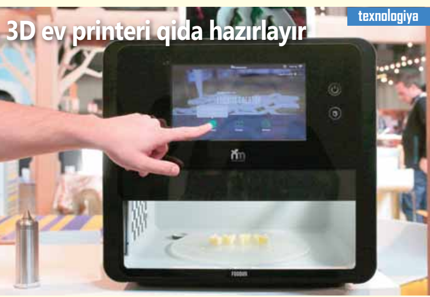
3D ev printeri qida hazırlayır

Alimlər düşünürlər ki, «Lipson» qurğusu 2020-2025-ci illərdə hər bir mətbəxin bəzəyi olacaq.