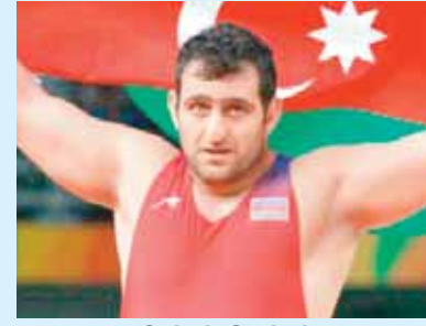
Sabah Şəriəti yunan-Roma güləşi, bürünc