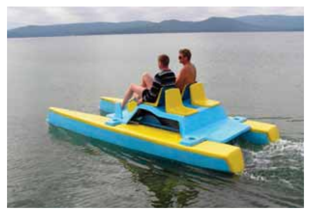
Dəniz nəqliyyatı vasitəsi

rübəsində səsvermə nəticəsində əmələ gələn fikir, rəy, mülahizə. Soldan sağa: 1.Azərbaycan sovet cərrahı, ictimai və dövlət xadiminin soyadı. Azərbaycanda tibb təhsilinin və səhiyyənin təşkilatçısı, respublikada cərrahlıq elmi məktəbinin banilərindən biri; 8.Qədim Rusiya xalq idman növü. Oyunda əsas məqsəd müxtəlif dizaynlarla qoyulmuş keçlləri dəyənəklə yıxmaqdır; 9.Üzüm və almadan hazırlanan turş maye; 10.Ölkəmizdə mövcud olmuş aviaşirkət; 11.Bədii ədəbiyyatda romanın bir şəkildir. Epik janrın ən mürəkkəb və geniş növüdür; 12.Əxlaq, ənonə mənalarını verən fəlsəfi termin; 14.Ən yüksək məqsəd, qayə, amal. Mükəmməllik; 19.Allahın elçilərindən biri; 21.Məcbur, məcburiyyət qarşısında qalmaq; 22.İtalyan bəstəkarı Cüzeppa Verdinin bəstələdiyi məşhur opera əsəri; 23.Qızıl Orda xanı; 24.Birinci; 25.Dəniz nəqliyyatı vasitəsi.