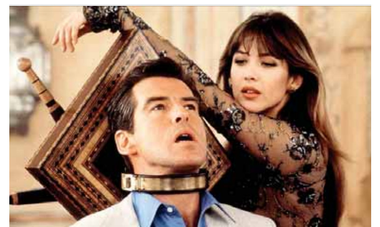
«Dünya kifayət deyil» filmindən epizod

radıcısı; 21.Rusiyada çay; 22.Ya-Adətən obyektlərin girişində qurpuniyada şəhər; 23.Oxu şaqulı və ya üfqi istiqamətdə hərəkət edib, yolu açib-bağlayan xüsusi qurğu. 25.Nüfuz, hörmət, ad-san.