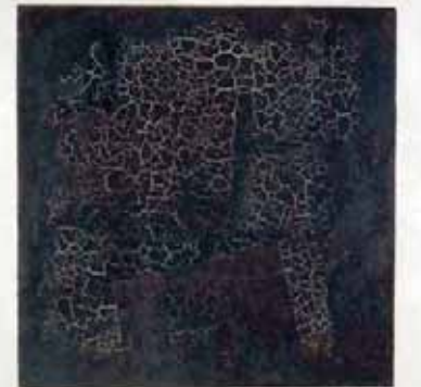
«Qara dördbucaq» abstrakt əsəri

nin yaradıcılarından biri; 10.Ötən əsrin 90-cı illərində məşhurlaşmış oyun konsolu; 11.Tanınmış Rusiya və sovet avanqardçı rəssamı. Pedaqoq, filosof və suprematizmin banisi. «Qara dördbucaq» abstrakt əsərinin müəllifi; 12.Yaponiyada bir neçə sahəni əhatə edən iri ticarət evi. «Azəri-Çıraq-Günəşli» neft yataqlarının işlənməsi layihəsində tərəfdaş şirkət; 14.Hər hansı bir şirkətin məhsullarını topdan alıb, sonradan pörəkəndə və kiçik partiyalarla satılması ilə məşğul olan hüquqi və ya fiziki şəxs; 19.Kimyəvi reaksiyaların sürətləndirilməsi üçün əlavələr; 21.«Qaracaqız» filmində (1966) Tutu obrazını canlandıran aktrisanın adı; 22.Qədim Yunanıstanda xoş ətirli yağ və efirlər, həmçinin şərabi saxlamaq üçün xüsusi qab; 23.Əsasən palto və kostyum tikmək üçün keyfiyyətli yun parça növü; 24.Ordubad rayonunun Azadkənd kəndi yaxınlığında orta əsrlərə aid yaşayış yeri; 25.Tərsinə oxunuşu da eyni olan cümlə, söz