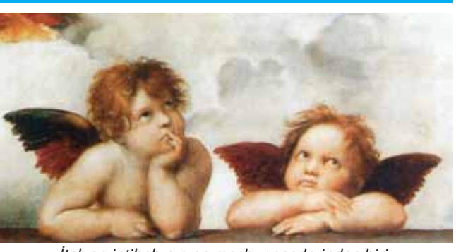
İtalyan intibahının ən məşhur əsərlərindən biri, «Sikstin Madonnası»ndan fraqment

xi Şəcərə Cəmiyyətinin üzvü; 21.Xüsusi, ayrıca buraxılış üzrə yerləşdirilən qiymətli kağızlar, istiqrazlar seriyası. Soldan sağa: 1.Su, şəkər, nişastadan hazırlanmış türk şirniyyatı; 8.Öndə gedən, qabaqcıl, lider; 9.Kimyəvi element (qaz); 10.Olimpiya çempionu Azərbaycan cüdoçusunun adı; 11.Avtomobil markası (sportkar); 12.Düzbucaqlı üçbucağın düz bucağı əmələ gətirən tərəflərin hər biri; 14.Detalları birləşdirmək üçün işlədilən silindri mil; 19.«Neftçi» FK, Moskvanın «Dinamo» FK komandalarında oynamış azərbaycanlı hücumçunun adı. SSRİ-nin əməkdar idman ustası (1960), SSRİ-nin əməkdar