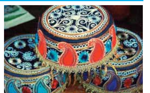
Bezi müsəlman ölkələrində milli baş geyimi

əsrin 90-cı illərində populyar olan oyun konsolu. Soldan sağa: 1.Mağaraların tavanında əmələ gələn konus şəkildə əhəng, damla daş; 5.Üç ölkə ərazisindən axan çay; 7.Müxtəlif sənədləri, hüquqi aktları təsdiq etmək vəzifəsi daşıyan rəsmi şəxs; 8.Rusiya, Qazaxıstan ərazilərindən keçib Xəzər dənizinə tökülən çay. Fin və ya qədim türk dilində «aydın gecə» mənasını verir; 10.Azərbaycan rəssamının adı. Əsərləri bir sıra kitab və jurnallarda çap olunub. Bir çox sərgilərin və müsabiqələrin iştirakçısı, «Karikaturaçı Rəssamlar Birliyi»nin üzvüdür; 11.Avtomobil markası; 12.Bank tərəfindən alqı-satqısı həyata keçirilən qiymətli kağızların alışı və ya satışı kursu; 14.Azərbaycanlı bəstəkar, xalq artisti və əməkdar incəsənət xadiminin adı. Azərbaycanda ilk rok operettasının müəllifi; 19.Qiymətli nadir əşya, hal,