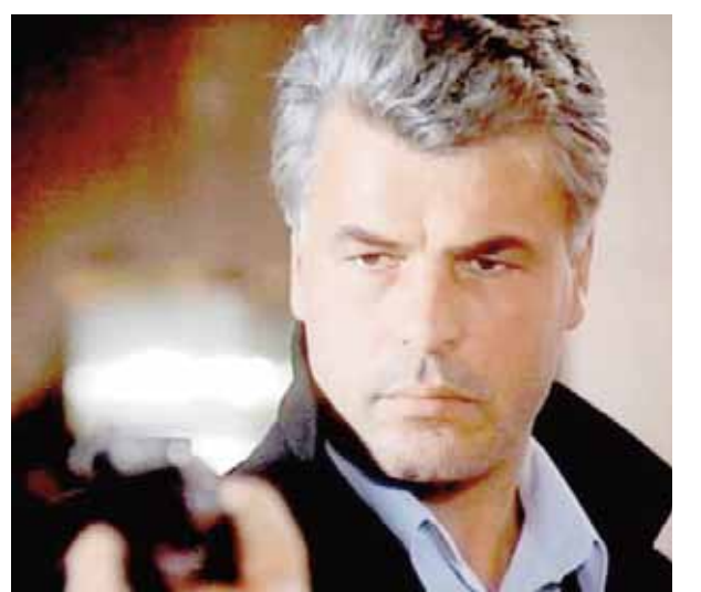
Mikele Plaçidonun «Sprut» serialında canlandırdığı obraz

infeksion xəstəliyi; 9.ABŞ-da ştat; 10.Binanın daxilində üst örtüsü; 11.Mikele Plaçidonun «Sprut» serialında canlandırdığı obraz; 12.Roma siyasi və hərbi xadimi; 14.Üst paltar üçün naxışlı yun parça; 19.Müstəqil dövlət-şəhər və Roma katolik kilsəsinin mərkəzi; 21.RF-nin Komi Respublikasında göl; 22.Şərqsünas, tarixçi, Sovet İttifaqı Qəhrəmanı, əməkdar elm xadiminin adı; 23.Pyeslər, səyahətnamələr, romanlar və şeirlər də yazmasına baxmayaraq, daha çox nağıllarına görə tanınan danimarkalı ədib; 24.Ölkəmizdə fəaliyyət göstərən informasiya agentliklərindən biri; 25.Kosmik aparatlar üçün liman.