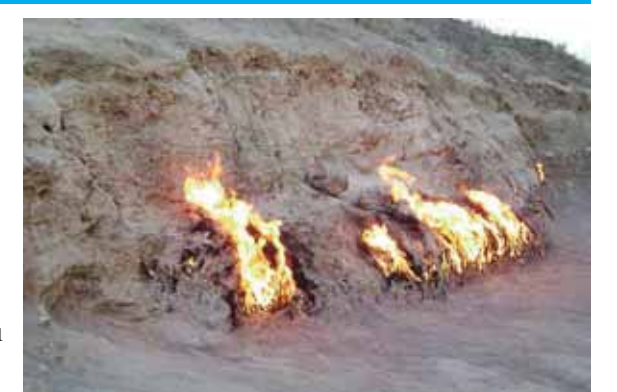
Bakı şəhəri yaxınlığında təbii qazın çıxması nəticəsində alovlanan, tarixi bilinməyən təbiət abidəsi

aşırım» povestinin qəhrəmanlarından biri, «Qırmızı tabor»un komandiri; 5.Mərkəzi Afrikada dövlət; 7.Bakı şəhəri yaxınlığında təbii qazın çıxması nəticəsində alovlanan, tarixi bilinməyən təbiət abidəsi; 8.Döş qəfəsində yerləşən əzələvi üzv; 10.Türk və monqollarda nəslitayfa birliyi forması; 11.Uzun müddət ərzində iki mümkün dayanıqlı tarazlıq vəziyyətindən birində ola və xarici idarəedici siqnalın təsiri ilə sıçrayışla bir vəziyyətdən digərinə keçə bilən qarış; 12.Almaniya yada şəhər (Bavariya); 14.Culfa rayonunda kənd; 19.Böyük göllər qrupuna daxil olan göl (ABŞ-da yerləşir); 21.Ölkəmizdə və Yaxın Şərqdə geniş yayılmış şirniyyat növü; 22.Misin qalay, alüminium, berillium