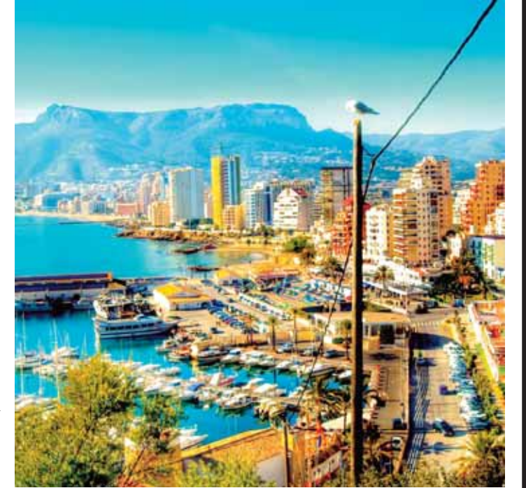
İcmalı Vergi siyasəti və strateji araşdırmalar Baş İdarəsi təqdim edib

Vergi ödəyicisindən ödəmə mənbəyində tutulmuş və ya cari ödənişlər şəkildə qəbul edilmiş məbləğ yekun vergi öhdəliyindən çox olarsa, artıq məbləğ qaytarılır.