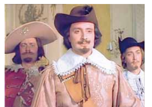
«D'Artanyan və üç müşketyor» filmindən epizod. Venyamin Smexovun canlandırdığı obraz

5.İdarəetmədə magistr ixtisas dərəcəsi, ingilis dilindən alınmış qısaltma; 7.Qədim sikkələri və medalları yığan və tədqiq edən mütəxəssis; 8.Əsasən Azərbaycanın şimalında və cənubunda yarıköçəri (yaylaq-qışlaq) maldarlıqla məşğul olan sosial zümərə; 10.Yunan mifologiyasında Krit hökmdarı; 11.Paytaxtımızın Yasamal rayonunun SSRİ dövründəki adı; 12.Yaradıcılıq zamanı özünü göstərən ruhlanma halı, yaradıcı fikri yüksəlişi; 14.Türk və moqollarda tayfa birliyi forması; 19.Azərbaycanın futbol tarixində silinməz izlər qoyan futbolçunun adı. Hücumçu, məşqçi, «Neftçi»nin kapitanı, SSRİ-nin ömükdər idman ustası; 21.Çar Rusiyasında qapalı orta hərbi məktəb müdavimi; 22.Pul vəsaiti və ya natural formada alınan aktiv, habelə hər hansı iqtisadi subyekt qarşısında icra olunmamış öhdəlik;