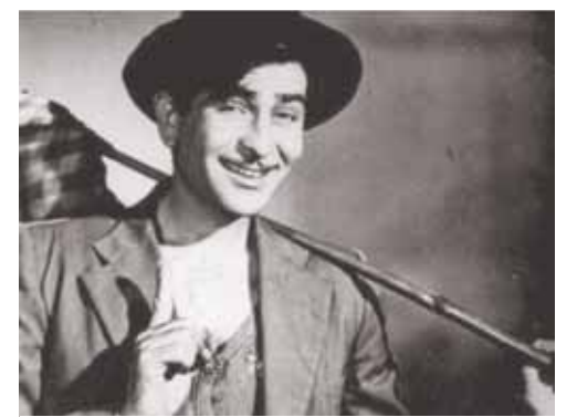
«Avara» filmindən epizod

sının hücumçusunun soyadı. Soldan sağa: 1.Mübadilə fəaliyyətini həyata keçirmək üçün bazarda aparılan məqsədyönlü fəaliyyət; 5.Zirehli texnika əleyhinə qumbaraatan; 7.Yevlax rayonunda kənd; 8.Rusiya-da çay; 10.Türk dilində ilin 5-ci ayının adı; Türkiyə təqvimində ilin 5-ci ayının adı; 11.Neptunun üçüncü ən böyük peyki; 12.Müasir döyüş sənəti, idman növü; 14.Respublikamızda rayon; 19.Aypara şəklində olan içi ətli italyan piroqu; 21.Cənubi slavyan xalqlarında simli, kamanlı çalğı aləti; 22.Piriney yarımadasında ən böyük çay; 23.Bor tərkibli alüminat qrupundan mineral (qırmızı, bənövşəyi, çəhrayı, göy, yaşıl və s. rənglərdə olur) zinət əşyalarının istehsalında geniş istifadə olunan qiymətli daş; 24.Məşhur hind kinorejissoru, ssenarist, prodüser