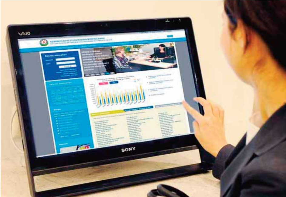
Milli Ödəniş Sisteminin inkişafı ölkənin maliyyə sabitliyi və təhlükəsizliyi baxımından olduqca vacib əhəmiyyət kəsb etdiyindən MB adekvat qabaqalıcı tədbirləri də genişləndirib

müasir texnologiya və proqram təminatlarına əsaslanan Milli Ödəniş Sistemi yaradılıb. Bu sistem istifadəyə verilməsi ilə banklararası hesablaşmaların tam elektronlaşdırılmasına nail olunub. Vaxtilə həftələrlə vaxt aparılan hesablaşma əməliyyatları hazırda bir neçə saniyə ərzində başa çatdırılır. Eyni zamanda, Mərkəzi Bank ilə Rabitə və Yüksək Texnologiyalar Nazirliyinin birgə layihəsi çərçivəsində «Azərpoçt» MMC nağdsız ödəniş bazarına fəal şəkildə cəlb olunub.