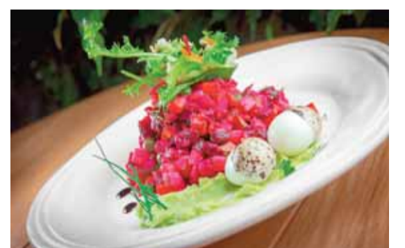
Kartof, kələm, çuğundur, yumurta və sirkə ilə hazırlanan soyuq yemək (qəlyanaltı)

si; 18.Rusiyada XX əsrin əvvəllərində iki futbol klubunun birləşməsindən əmələ gələn yeni futbol klubunun adı; 20.Yundan və ya pambıqdan toxunan xovsuz xalça növü; 21.Qara dənizin Gürcüstan sahilində qəsəbə. Kurort kimi məşhurdur. Soldan sağa: 1.Naxçıvan şəhərinin cənub-şərqində, Araz çayı sahilində yerləşən hərbi istehkam tipli qala; 5.Xalq arasında yayılmış adət, ənənə; 7.Nikbinlik; 8.Cəlilabad rayonunda kənd; 10.Xanəndə, Azərbaycanın xalq artisti adı (1934-2008); 11.ABŞ-da ştat; 12.Karotin, C vitamini, şəkər, üzvi turşular və pektin maddələrlə zəngin olan bitki; 14.Xörək hazırlayan usta; 19.ABŞ kinorejissoru və prodüserinin soyadı. «Xaç atası» filminin ssenaristi; 21.Rusiya Federasiyasının Lipetsk vilayətində şəhər; 22.Qadın adı; 23.Kartof, kələm, çuğundur, yumurta və sirkə ilə hazırlanan soyuq yemək (qəlyanaltı); 24.Hava-ya sovrulan torpaq donəcikləri; 25.Süsənkimilər fəsiləsindən çoxillik bitki növü; qarğasoğanı.