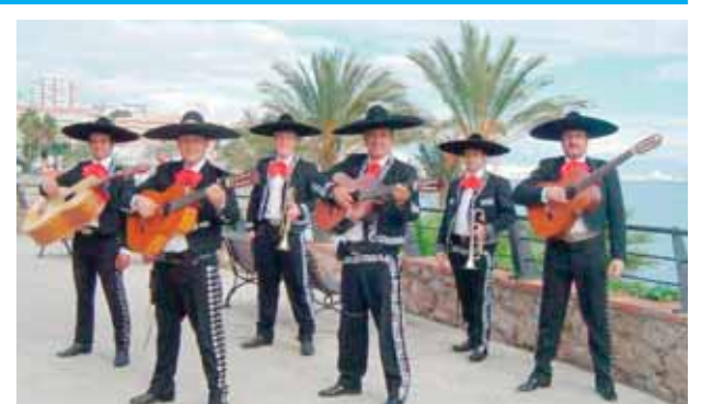
Latin Amerikas, İspaniya və ABŞ-in cənub-qərb regionlarında məşhurlaşmış meksikalıların xalq musiqisi janrı

böyük zövq aldığı fəaliyyət. Soldan sağa: 1.Adı Nizami Gəncəvinin «Sirlər xəzinəsi» əsərində çəkilmis İran padşahı; 5.Kalsiumla zəngin qida məhsulu; 7.Vahid mərkəzdən idarə edilən, vahid kommuna uğrunda aparılan inqilabi hərəkət və həmin hərəkətin üzvü; 8.Qayıq sürmək üçün kürek, qayıqçı küreyi; 10.Aldatmaq məqsədi ilə deyilən əsilsiz söz; 11.Latin Amerikas, İspaniya və ABŞ-in cənub-qərb regionlarında məşhurlaşmış meksikalıların xalq musiqisi janrı; 12.Amerika ədəbiyyatında romantik cərəyanın yaradıcılarından olan yazıçılardan birinin adı; 14.Hindistanda və Şərqi başqa ölkələrində: əsli-nəsəbi, ata-baba peşələri və hüquqi vəziyyətləri cəhətdən bir-biri ilə bağlı olan qapalı ictimai qrup, təbəqə, silk; 19.Məhrumun cəsədinin olmadığı yerdə ucaldılan başdaşı; 21.Almaniya çayı; 22.Perunun paytaxtı; 23.Afrika dövlət; 24.Mənşə və bəzi irsi xüsusiyyətlərinə görə bir olan tarixən şəxskül tapmış insan qrupu; 25.Həmişə bir yerdə olan, yerini dəyişməyən, bir yerdən başqa yere köçürülməyən idarə, əşya.