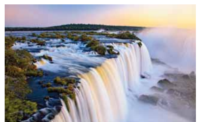
Braziliya ilə Argentinanın sərhədində yerləşən və UNESCO tərəfindən Ümumdünya irsi siyahısına daxil edilmiş təbiət abidəsi. Şəlalə

ratmaq və bununla bir tərəfdən digər tərəfə qüvvə ötürmək üçün birləşmə qurğusu; 21. İdarənin, müəssisənin və s. adı olan möhür. Soldan sağa: 1. Ürək xəstəliyi; 5. ABŞ-in Alyaska ştatında çay və şəhər; 7. Qədim Çin filosofu və mütəfəkkiri; 8. Slavyan xalqlarının ənənəvi içkisi, taxıldan və ya çörəkdən hazırlanır; 10. Mixəyi rəngdə piqment; 11. İdeal cəmiyyət yaratmaq haqqında qeyri-elmi fəlsəfi görüş, nəzəriyyə; 12. Bir şəkilin, rəsmnin və ya onun bir hissəsinin ilk qaralaması; 14. Cakomo Puccininin operası; 19. Almaniyalı yazıçı və Nobel mükafatı laureatı Elias Kanettinin 1935-ci ildə yazdığı 3 hissədən ibarət roman; 21. Xüsusi biçim-