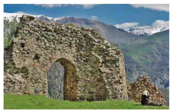
Kəlbəcər rayonu ərazisində Qanlıqend yaxınlığında yerləşən XIII-XIV əsrlərə aid istehkam tipli qala

nın necə və nə cür dəyişib indiki şəkildə düşdüyünü öyrənən ictimai elm sahəsi; 21.Cərəyan şiddətinin vahidi. Soldan sağa: 1.Orqanizmin xəstəliyə yoluxmamaq üçün müqavimət qabiliyyəti; 5.Fransanın cənubunda çay; 7.Tərtibçi, rəssam; 8.Kimyəvi element; 10.Türkiyə müğənnisinin adı; 11.Azərbaycan xalq rəqsi; 12.Dramaturq, aktyor, 1959-cu ildən Azərbaycan Yazıçılar Birliyinin üzvü, Azərbaycanın Əməkdar artistinin adı. «Qayınana» komediyasının libretto müəllifi; 14.Amerika romantizminin ilk görkəmli nümayəndələrindən biri. «Sonuncu mögikan» əsəri yaradıcılığının zirvəsi hesab olunur; 19.Teatr tamaşalarında və kinoda rol ifadə edən qadın artisti; 21.Müəssisənin sahib olduğu bütün maddi mülkiyyəti əhatə edən anlayış, mühasibat termini; 22.Rəng; 23.Karton və ya kağızdan