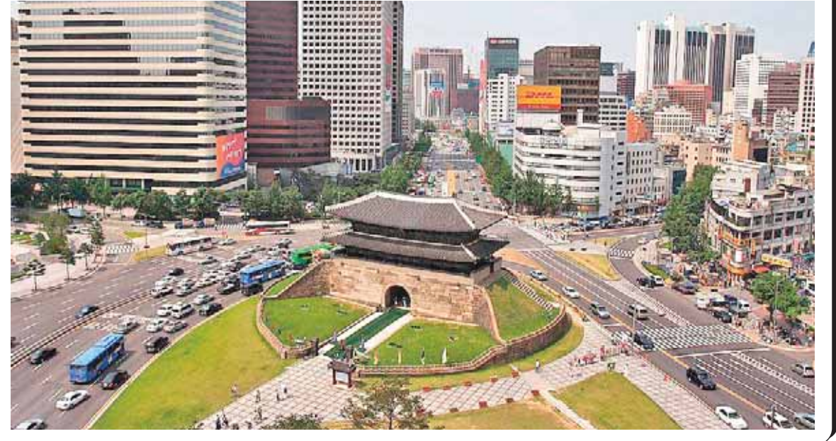
Rubrika üçün materialları Vergi siyasəti və strateji araşdırmalar Baş İdarəsi təqdim edib

Yunanistan hökuməti isə ölkədəki durumun ağırlığını etiraf edir.