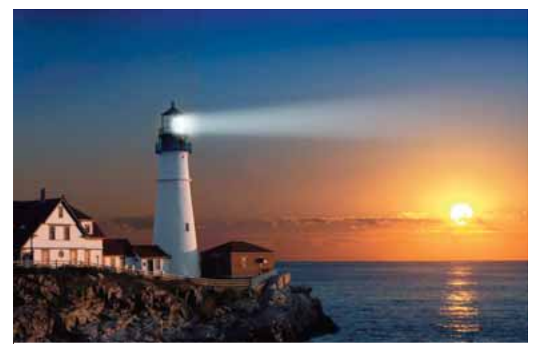
Gəmilərə yol göstərən qurğu

Yuxarıdan aşağı: 1.Təcrübədə istifadə olunmaq üçün heyvanların laboratoriyaya şəraitində saxlandığı bina; 2.Şəhur rayonunda kənd; 3.Meşə; 4.Kamera-instrumental musiqinin əsas janrlarından biri. İtalyan dilindən tərcümədə «səslənmək» mənasını verir; 5.Minsk - Belarusun paytaxtı; 6.Yarış; 9.Mövsümi meyvə; 13.Lev Tolstoyun «Hərb və Sülh» romanında personajın adı; 15.Bərabərlik; 16.Türk, yakut və altay mifologiyasında su tanrısı; 17.Yeni Zelandiyada şəhər; 18.Ət və balıq yeməklərinin yanında verilən bişmiş xəmir, tərəvəz məmulatları (makaron, kartof, göy noxud və s.); 20.Neyronun iki çıxıntısından biri; 21. Gəmilərə yol göstərən qurğu. Beyləqan rayonunda qəsəbə. Soldan sağa: 1.BŞ-da ştat; 5.Şahmatda vəziyyət; 7.ABŞ-da ştat; 8.Fransız rəssamı, XIX əsrin Avropa akademizminin hamı tərəfindən qəbul olunan lideri; 10.Ruminiyada şəhər; 11.E.ə. XX-XIX əsrlərdə Cənubi Azərbaycanda və Xəzərin cənub hissəsində yaşamış qədim türk tayfalarından biri; 12.İdmançı; 14.Zürafələr fəsiləsinə aid heyvan növü; 19.Türkiyədə oriyental tipli xalq musiqisi janrı; 21.Poçt ödəniş nişanı; 22.Şəriətdə xüsusi qayda ilə yerinə yetirilən vacib əməl; 23.Qəzet-jurnal səhifələrində çap olunan əsərlərin, əsasən, satirik