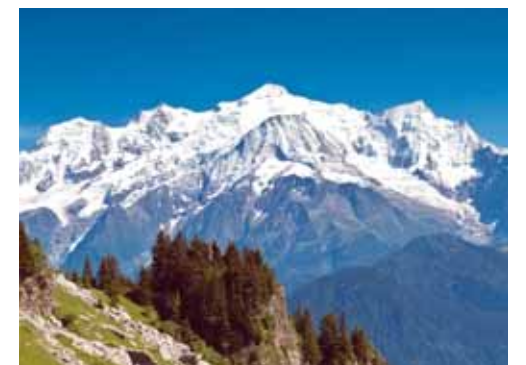
Alp dağ sistemində daxil kristal massiv

Yuxarıdan aşağı: 1.Rusiya Federasiyasının paytaxtı; 2.Kimyəvi element; 3.Meksikada bələdiyyə; 4.Qabaqcadan hazırlanmış suallara cavab almaq üçün sorğu vərəqəsi; 5.Fiqurlu konkisürmədə ən sadə tullanma; 6.Döyüş əməliyyatlarının aparılması və yerləyişmə üçün minik atlarından istifadə edilən qoşun növü; 9.Kişi adı; 13.İtaliya bəstəkarı Cüzeppe Verdinin populyar opera əsəri; 15.Tərcümədə «ağ dağ» mənasını verən kristal massiv - Alp dağ sisteminə daxil olan Qərbi Alp dağlarında yerləşir; 16.Şərqdə ilk opera («Gəlin qayası») yazan bəstəkar qadın. Azərbaycanın xalq artisti, populyar mahnı və romansların, operetna və pyeslərin müəllifinin adı; 17.Hollivud ulduzu, ABŞ-ın Kaliforniya ştatının keçmiş qubernatorunun adı; 18.Qədim Misir mifologiyasına görə qoruyucu tanrı (başı insan, bədəni şir); 20.Açıq, aşkar, gözlə görünən, göz qabağında olan; 21.Sibir və Kazan xanı (1496-1497). Soldan sağa: 1.Dağıstan Respublikasının paytaxtı; 5.Rusiya Federasiyasının Perm vilayəti ərazisində çay; 7.Yunanıstanın ikinci böyük şəhəri; 8.Yanma zamanı çıxan od; 10.Rusiya Federasiyasının Sverdlovsk vilayəti ərazisində çay; 11.Abşeron ərazisində yerləşən, bütün Şərqdə nadir gözəlliyi ilə diqqəti cəlb edən, yaşı bir əsrdən çox olan məscid; 12.Türk mifologiyasında od tanrısı (xan); 14.Moskvanın mərkəzində tarixi kompleks; 19.Kişi adı; 21.Yazıçı, nasir, türçüməçi, geologiya-mineralogiya elmləri namizədi (1942), dosent, əməkdar mədəniyyət xadimi. «Firtına», «Zirvələrdə», «Dalğalar qoynunda» və