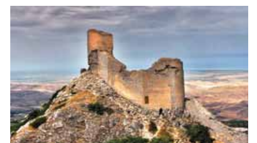
Şabran rayonunda istehkam tipli qədim qala

bində şəhər; 20.Pişiklər fəsiləsinin qar bəbirləri cinsinə aid heyvan növü; 21.1918-ci ildə Rusiya ilə «Dördlər ittifaqı» (Almaniya, Avstriya-Macarıstan, Türkiyə və Bolqarıstan) arasında sülh müqaviləsinin bağlandığı şəhər. Müqavilə həmin şəhərin adı ilə adlandırılır. Soldan sağa: 1.Şabran rayonunda istehkam tipli qədim qala; 5.Qərbi Avropanın hündür dağ sistemi; 7.Qədim Yunanıstanda və Misirdə çıxılması çətin, dolanbac və dolaşmaq yolları olan böyük tikili; 8.Orta əsrlərdə Avropada kasıb və orta təbəqədən olan insanlar arasında geniş yayılmış və əsasən, taxtadan düzəldilən başmaq; 10.Partlayıcı maddə; 11.RF-nin Yaroslavl vilayətində şəhər; 12.Radioaktiv kimyəvi element; 14.Romantik dövrü təmsil edən alman bəstəkarının soyadı; 19.Xırdə doğranmış et, kərə yağı və undan alınan və dünyə ilə yeyilən raqu; 21.Qarabağ xalçaçılıq