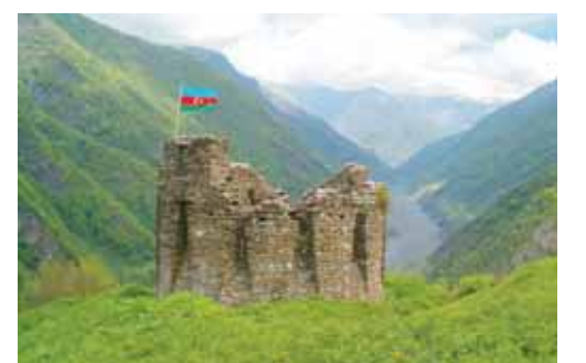
Qax rayonunun İlisu kəndində Yazlıq dağının üstündə inşa olunmuş müşahidə təyinatlı istehkam

və ya investisiya edilmiş ümumi məbləğ; 5. Ləzzət, insan duyğularından biri; 7. Azərbaycan sovet şairi, dramaturq və ictimai xadimin adı, «Ana və poçtalyon», «Təbrizim» kimi populyar şeirlərin müəllifi; 8. Məşhur hind aktyoru və prodüseri; 10. 1991-ci ildə Xocavənd rayonu yaxınlığında «Mih-8» vertolyotunun erməni hərbi birləşmələri tərəfindən vurulması nəticəsində şəhid olmuş Azərbaycan Respublikasının ilk Baş prokurorunun adı; 11. «İtkin gəlin» filmində (1994) Əfsanə obrazını canlandıran Azərbaycan aktrisasının adı; 12. Avrasiya və Afrikada geniş yayılmış bitki; 14. Alman-skandinav mifologiyasında personaj; 19. Naxçıvan şəhərindən 12 km cənub-şərqində orta əsr şəhəri; 21. Kamerunun cənub-qərbində şəhər; 22. Türk mifologiyasında əfsanəvi xaq