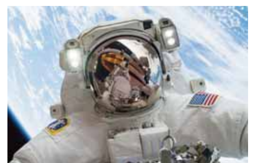
Rəqəmsal kamera, kameralı mobil telefon və ya planşet ilə çəkilən avto-portret növü

yaşayan xalq. Soldan sağa: 1.Doktorluq dissertasiyası hazırlamaq üçün bir elmi idarəyə təhkim olunmuş alim; 5.Bolqarıstanın şimalında çay; 7.Qiymətli kağızlar bazarında satın alınmış səhmlərin dəyərinin ödənişinin növbəti hesablaşma dövrünə qədər təxirə salınması imkanı; 8.Türk mifologiyasında korlar tanrısı (xan); 10.Yaponiyanın Tokiodan sonra ikinci böyük şəhəri; 11.İranda duzlu göl; 12.XIX əsr görkəmli Azərbaycan şairi; 14.Yağda qovrulmuş un və doşabdan, bəzən də baldan, şəkərdən bişirilən Şərq şirniyyatı; 19.Uzaq Şərqdə çay; 21.Rəqəmsal kamera, kameralı mobil telefon və ya planşet ilə çəkilən avto-portret növü; 22.Sahibinə hər hansı müəssisənin aktivlərində müəyyən bir paya sahiblik və payına uyğun olaraq müəssisənin gəlirinin