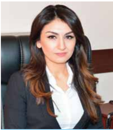
Samira Musayeva, Vergilər Nazirliyinin Hüquq Baş İdarəsinin rəisi

Azərbaycan Respublikasında aparılan vahid maliyyə və büdcə siyasəti çərçivəsində dövlət vergi siyasətinin həyata keçirilməsini, dövlət büdcəsinə vergilərin və digər daxilolmaların vaxtında və tam yığılmasını təmin edən və bu sahədə dövlət nəzarətini həyata keçirən Vergilər Nazirliyi ona həvalə edilmiş vəzifə və funksiyaların icra edərəkən hüquqi dövləti səciyələndirən hüquq və azadlıqların üstünlüyü prinsipini rəhbər tutaraq, vergi ödəyicilərinin hüquqlarını və qanuni mənafelelərini təmin edir, bu istiqamətdə qanunvericiliklə müəyyən edilmiş bütün zəruri tədbirləri görürək əməli addımlar atr.