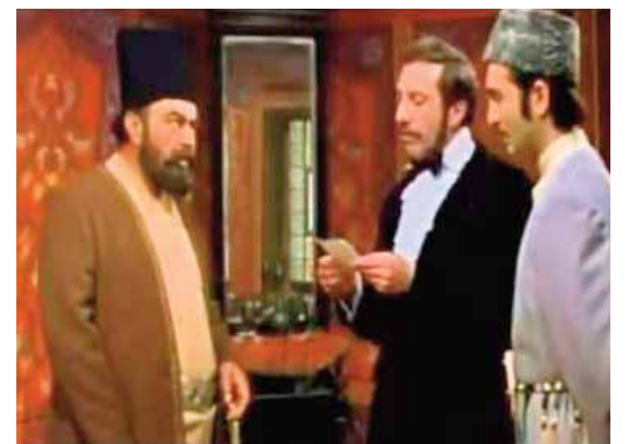
«Dərviş Parisi partladır» filmindən epizod.

Yuxarıdan aşağı: 1.Dondurma əlavə edilmiş qəhvə əsaslı soyuq içki; 2.Söykənəcəyi olmayan sadə stul, kətil; 3.Qədim Roma şairi; 4.Avtomobil markası; 5.Əfqanıstanın paytaxtı; 6.Ağstafa rayonunda Azərbaycanın görkəmli xalq şairinin adını daşıyan qəsəbə; 9.İslam ölkələrində dövlətə məxsus ərazilərin və ya gəllirlərin qanuni şəkildə konkret şəxslərə verilməsi; 13.Yuxu ruhu; 15.Afina dövlət xadimi, İran-yunan müharibələri dövründə (e.ə. 500-449-cu illər) yunan sərkərdəsi; 16.Respublikamızda rayon; 17.Süni qeyri-qrqanik bərkidici tikinti materialı. Əsas inşaat materiallarından biri; 18.Mülki hüquqda bir tərəfin öz əmlakını əvəzsiz olaraq digər tərəfin mülkiyyətinə verməsi haqqında müqavilə; 20.«Dərviş Parisi partladır» filmində Dərviş Məstəli şah obrazını canlandıran aktyorun adı; 21.Bank əməliyyatlarının aparılması haqqında bildiriş. Soldan sağa: 1.Afrikanın cənubunda etnik icma; 5.«Dördüncü hakimiyyət», müasir sivilizasiyanın ən mühüm amillərindən biri; 7.Balkan yarımadasında yerləşən ölkə; 8.Qədim türk mənşəli tayfanın adı; 10.Abşeron rayonunda qəsəbə; 11.Sakit Okeanın cənub hissəsində yerləşən Yeni Zelandiyanın mülkü olan arxipelaq; 12.Norveçin paytaxtı Oslo yaxınlığında ada; 14.Türk və altay mifologiyalarında ev tanrısı; 19.Şərab təchizatı ilə məşğul olan restoran işçisi; 21.Qadın adı; 22.Fiziki və ya mənəvi iztirab, əzabverici və ya xoşagəlməz hiss, əzab; 23.Türkiyə superliqasında mübarizə