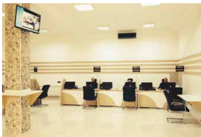
Sabunçu rayonu, Bakıxanov qəsəbəsi, Nazim İsmayilov prospekti, ev 276 ünvanında Bakı Şəhər Vergilər Departamentinin yeni Vergi ödəyicilərinə xidmət mərkəzi istifadəyə verilib.

Xidmət mərkəzində fiziki və hüquqi şəxslərin elektron qeydiyyatının aparılması, nəzarət-kassa aparatlarının, təsərrüfat subyektlərinin qeydiyyatına alınması və qeydiyyatdan çıxarılması, fəaliyyətin bərpası, dayandırılması, xitam verilməsi, uçot məlumatlarında dəyişiklik, bəyannamələrin, hesabat və arayışların göndərilməsi, bankda hesabın açılması,