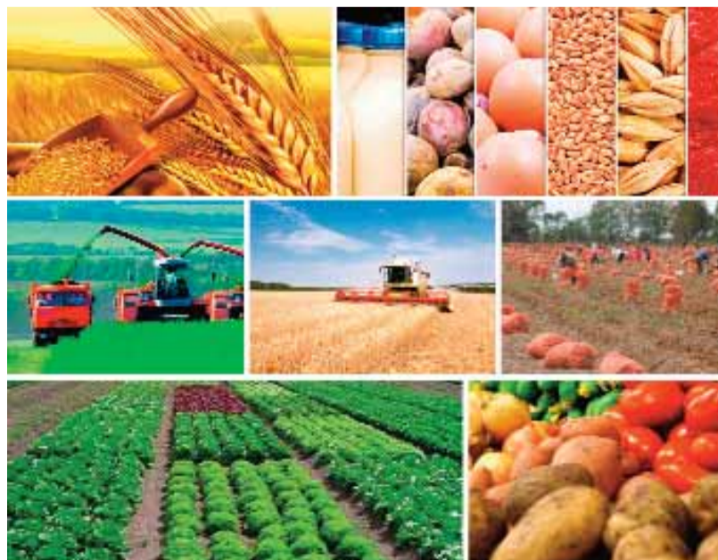
Kənd təsərrüfatı məhsullarının sığortalanması aqrar sektorla bağlı problemlə kreditlərin həcmi qismən azalda bilər