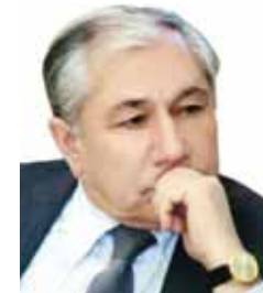
Akif Musayev Azərbaycan Respublikası vergilər nazirinin müşaviri