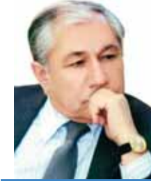
Akif Musayev Azərbaycan Respublikası vergilər nazirinin müşaviri