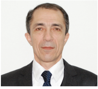
Asaf ƏSƏDOV, vergilər nazirinin müaviri