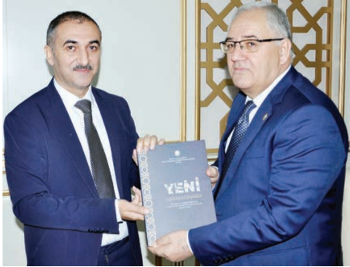
haqqında ətraflı məlumat verib. Mərasimdə Dövlət Sosial-İqtisadi Kollecinin müəllimi və tələbləri iştirak ediblər.

Təqdimat Ağdam Rayon İcra Hakimiyyəti və Ağdam Dövlət Sosial-İqtisadi Kollecinin birgə təşkilatçılığı ilə Heydər Əliyev Mərkəzində keçirilib. Təqdimetmə zamanı R. Hüseyn Qarabağ və Şərqi Zəngəzur iqtisadi rayonlarının da postkonflikt quruculuğu