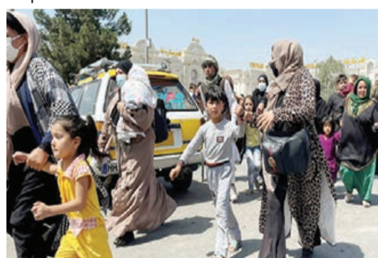
xalq səviyyədə tanınmasına nail olmağa çalışırlar.

Ötən ay Moskvada taliblərin iştirakı ilə danışıqlar aparılıb. Onlar hakimiyyətə gələndən sonra Əfqanıstanda müvəqqəti hökumət yaradıldı və hazırda onun beynəlxalq