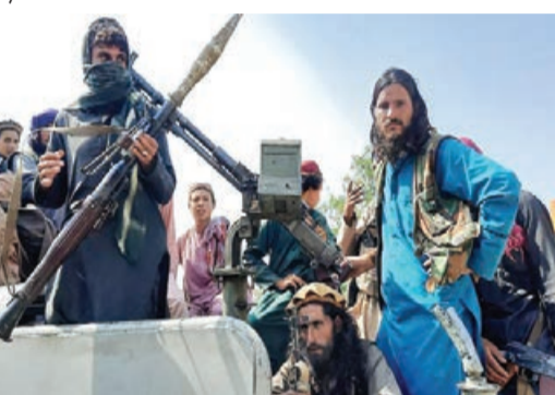
Rusiya Təhlükəsizlik Şurasının katibi Nikolay Patrusev “Taliban”ın (Rusiyada qadağan olunmuş terror təşkilatı) hakimiyyətə gəlişini “ABŞ və müttefiqlərinin yirmin illik məsuliyyətsiz siyasətinin qanunauyğun finalı” adlandıraraq deyib: “Əfqanıstanda misli görünməmiş ağır vəziyyət yaranır - istər hərbi-siyasi, istərsə də sosial-iqtisadi baxımdan”, sonradan isə hadisələr fəlakətli ssenariyə üzrə inkişaf edə bilər”.