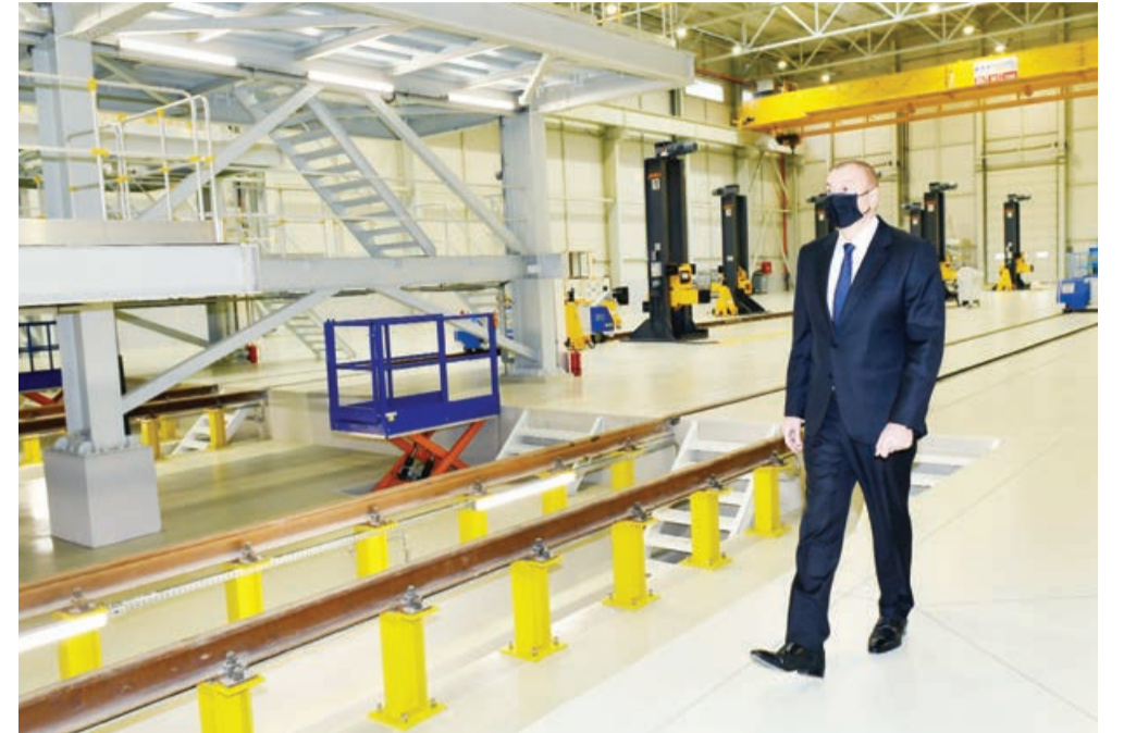
Əvvəli 1-ci səh.

Ümumilikdə, bu deponun istifadəyə verilməsi enerji resurslarının qənaətinə, istismarın asanlaşmasına, qatarların hərəkət sürətinin artırılmasına və nəticə etibarlı yük və sərnişin daşımalarında səmərəlilik göstəricilərinin yaxşılaşdırılmasına, lokomotivlərin gücünün çoxalmasına imkan yaradacaq. Depoda xarici ölkələrdə təlim keçmiş 150-yə yaxın yüksəkixisaslı işçi çalışacaq.