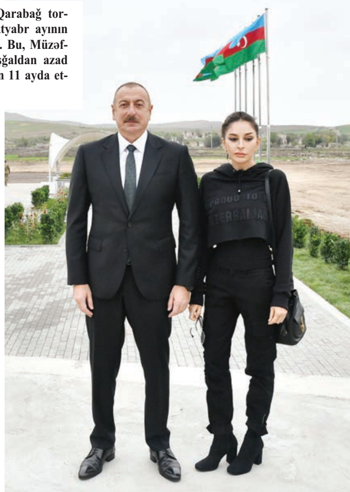
Ardı 5-ci səh.

Vətən müharibəsinin ilk günü Füzuli rayonunun bir