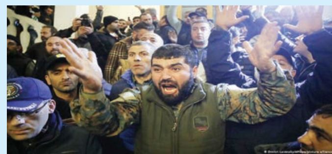
Ardı 8-ci səh.

Erməni ekspertlərinin özləri də etiraf edirlər ki, bu gedişlə ölkə daha böyük fəlakətlərlə üzləşməli olacaq. Yaşanan iqtisadi böhran şəraitində gündəlik istehlak, xüsusən də, ərzaq məhsullarının qiymətində artım ölkənin durumunu daha da pisləşdirir.