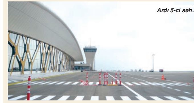
Ardı 5-ci səh.

Kənardan müşahidə aparıb həm işlərin gedişatını izləyir, həm də məlumat toplayırıd.