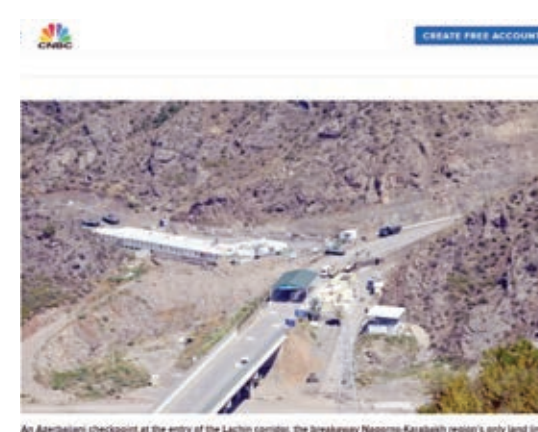
An Azerbaijan checkpoint at the entry of the Lachin corridor. The breakaway Nagorno-Karabakh region's only land road to Armenia.

ABŞ-nin CNBC televiziyasının elektron versiyasında yayımlanan məqalədə də Azərbaycanın Qarabağ bölgəsində konstitusiyaya quruluşunu bərpa etmək və Ermənistan silahlı qüvvələrinin birləşmələrini ərazidən çıxarmaq üçün antiterror tədbirlərinə başladığı qeyd olunub. Bildirilib ki, Azərbaycanın Müdafiə Nazirliyi yaydığı bəyanatda lokal xarakterli tədbirlərin məqsədinin Ermənistan silahlı qüvvələrinin birləşmələrinin türk-silah edilərək ərazilərimizdən çıxarılması, onların hərbi infrastrukturunun zərərsizləşdirilməsi, Azərbaycan Respublikasının konstitusiyaya quruluşunun bərpa edilməsi olduğu bildirilib.