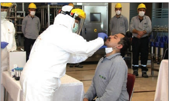
Əvvəlki 1-ci səh.

İnfeksiya üzərində üstünlük hər öten gün daha da möhkəmlənir