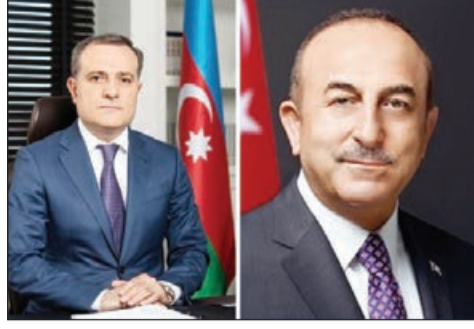
Mayın 19-da Azərbaycan Respublikası xarici işlər naziri Ceyhan Bayramov ilə Türkiyə Respublikasının xarici işlər naziri Məvlud Çavuşoğlu arasında telefon danışığı olub.

Xarici İşlər Nazirliyinin Mətbuat xidməti idarəsindən AZƏRTAC-a bildiriblər ki, telefon danışığı zamanı nazirlər bölgədəki cari vəziyyəti, o cümlədən Azərbaycan-Ermenistan sərhədində baş verən gərginliklə bağlı məsələləri müzakirə ediblər.