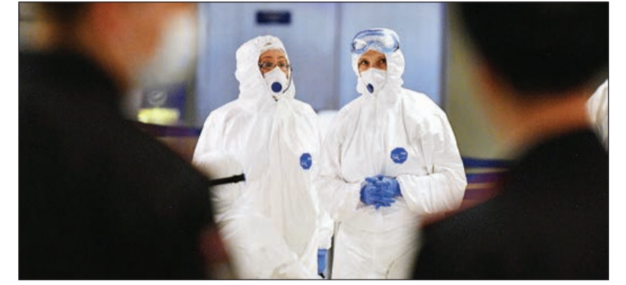
Əvvəl 1-ci səh.

Xatırladaq ki, aprelin 5-dən Bakı, Sumqayıt, Gəncə, Şəki şəhərləri və Abşeron rayonunun ümumi təhsil müəssisələrində tədris və təlim-təربiyə prosesi distans formaya keçirilmişdir.