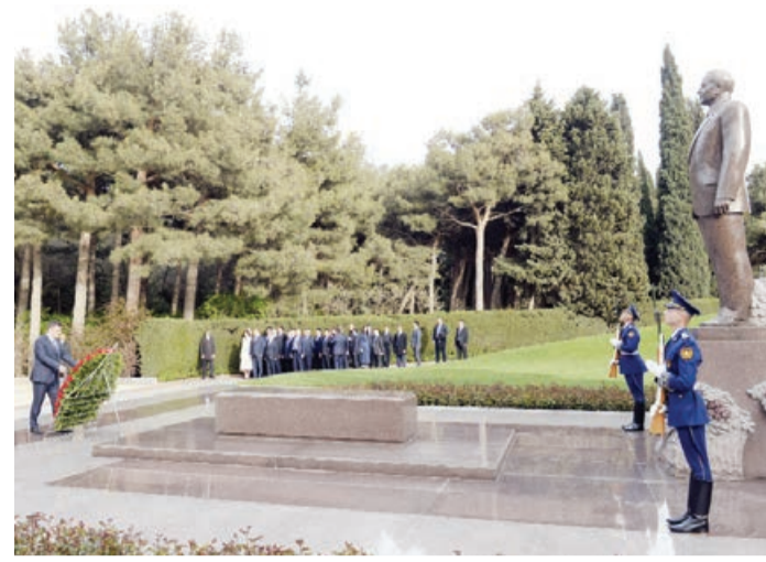
Əliyevin məzarı önünə əklil qoyub.

AZƏRTAC xəbər verir ki, Qırğız Prezidenti Sadır Japarov Ulu Öndər Heydər