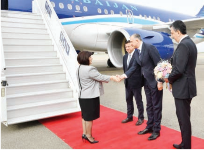
Aprel 19-da Milli Məclisin Sədri Sahibə Qafarovanın başçılığı ilə parlament nümayəndə heyəti Gürcüstanda