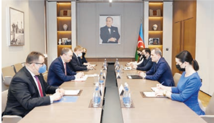
nün davamı olaraq, bölgədə mövcud olan cari vəziyyət, iki ölkə arasında münasibətlərin normallaşması istiqamətində

Xarici İşlər Nazirliyinin Mətbuat xidməti idarəsindən AZƏRTAC-a bildirilib ki, tərəflər Aİ Şurası Prezidentinin vasitəçiliyi və iştirakı ilə Azərbaycan və Ermənistan liderlərinin 6 aprel tarixli Brüssel görüşü-