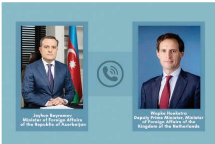
qələrin inkişaf perspektivləri üzrə fikir mübadiləsi aparılıb. Bu ilin 15 mart tarixində iki ölkənin Xarici İşlər Nazirlikləri arasında siyasi məsləhətləşmələrin keçirilməsi məmnunluqla vurğulanıb və bu təcrübənin gələcəkdə davam etdirilməsi-

Tərəflər ikitərəfli gündəlin cari məsələləri, habelə əla-