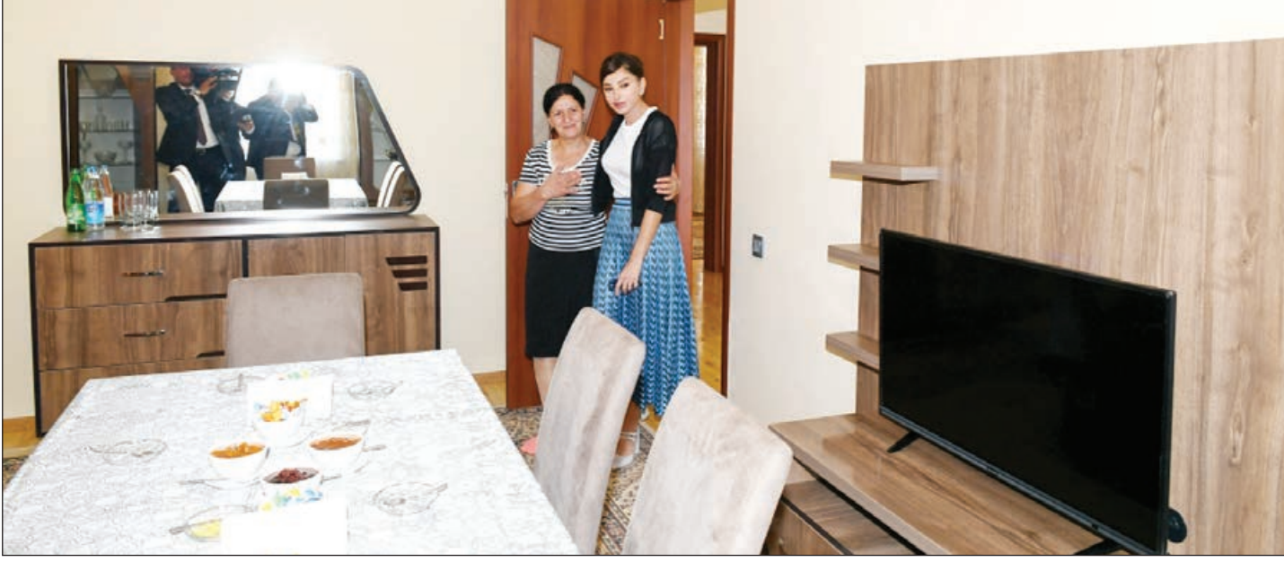
Əvvəli 1-ci səh.

Zəlzələdən sonra Heydər Əliyev Fondu tərəfindən Şamaxıda 35 fərdi ev tikilib, 12 evdə təmir-bərpa işləri aparılıb