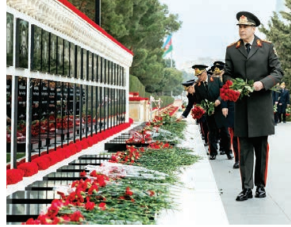
Yanvarın 19-da daxili işlər naziri general-polkovnik Vilayət Eyvazov və DİN-in şəxsi heyəti 20 Yanvar faciəsinin 33-cü ildönümü ilə əlaqədar Şəhidlər xiyabanını ziyarət ediblər.