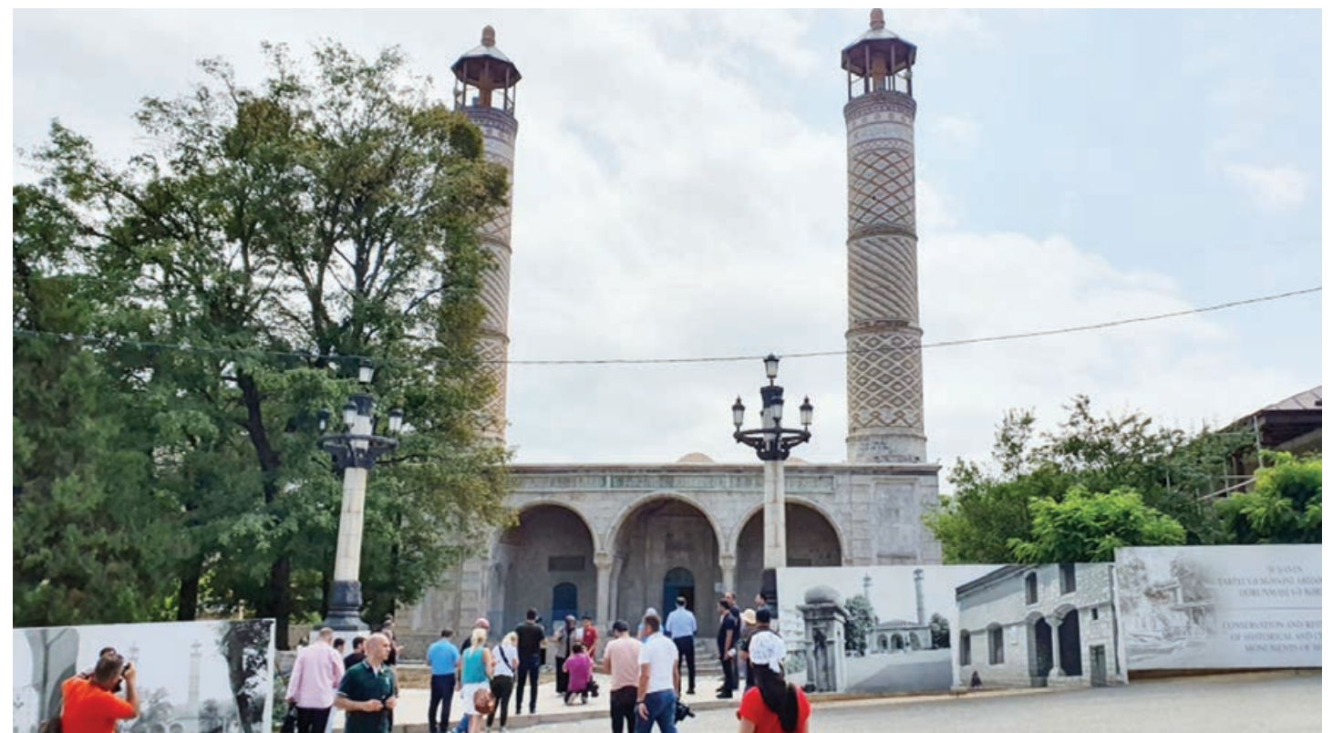
Türk Şurasına üzv və müşahidəçi dövlətlərin media nümayəndələri Şuşa şəhərinə səfər ediblər.

AZƏRTAC xəbər verir ki, səfər "Azərbaycana Media Tur" çərçivəsində həyata keçirilir. Türkiyə, Qazaxıstan, Qırğızıstan, Özbəkistan, Macarıstan, həmçinin Bosniya və Herseqovina və Serbiyadan olan jurnalistlər şəhərlə tanış olublar.