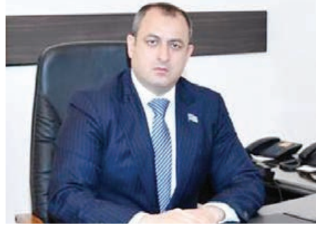
Məğrur və əzəmətli Şuşa əsl sahibinə qovuşdu

Yeri gəlmişkən, Azərbaycan Respublikasının Prezidenti İlham Əliyev Vaqif Poesiya Günlərinin rəsmi açılış mərasimində çıxışı zamanı bu kontekstdə çox mühüm məqamlara toxunaraq həm tarixi faktlara, həm də müasir reallıqlara nəzər saldı. Müzəffər Ali Baş Komandanımız 44 günlük Vətən müharibəsinin bizim şanlı tariximiz olduğunu bir daha xüsusi vurğulayaraq "Bu tarixi abədi yaşayacaq. Çünki bu Qələbə tarixdə bənəzi olmayan qələbədir. Azərbaycan xalqı buna layiq idi və biz Qələbə əldə edərək düşməni öz doğma diyarımızdan qovduq, şəhərlərimizi azad etdik, doğma Şuşamızı azad etdik", - deyə diqqətə çatdırdı.