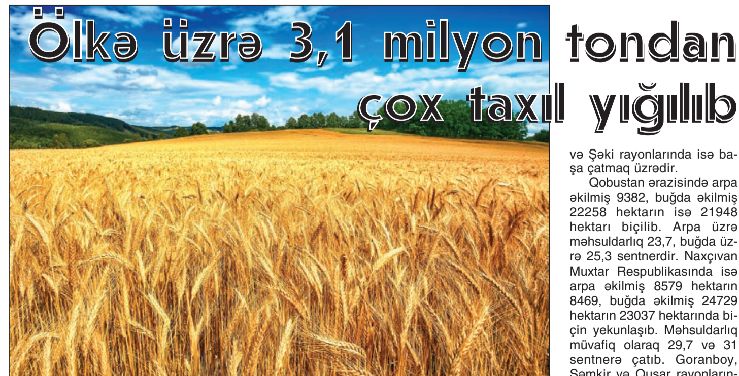
Ölkə üzrə 3,1 milyon tondan çox taxıl yığılıb

Abşeron, Ağdam, Ağdaş, Ağcabədi, Ağstafa, Ağsu, Astara, Balakən, Beyləqan, Bərdə, Biləsuvar, Cəlilabad, Cəbrayıl, Daşkəsən, Şabran, Füzuli, Naftalan, Göyçay, Hacıqabul, Xaçmaz, Xızı, İmişli, İsmayilli, Kürdəmir, Qax, Qazax, Qəbələ, Quba, Masallı, Neftçala, Oğuz, Sa-