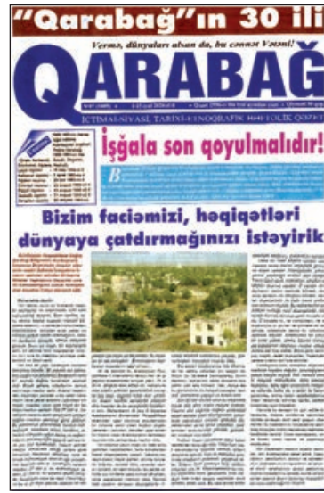
ra qarşı torpaq iddiası ilə bölgədə müharibə şəraiti yaratmışdı.

Həmin vaxt bölgədə erməni separatizmi baş qaldıraraq azərbaycanlılara qarşı torpaq iddiası ilə bölgədə müharibə şəraiti yaratmışdı.