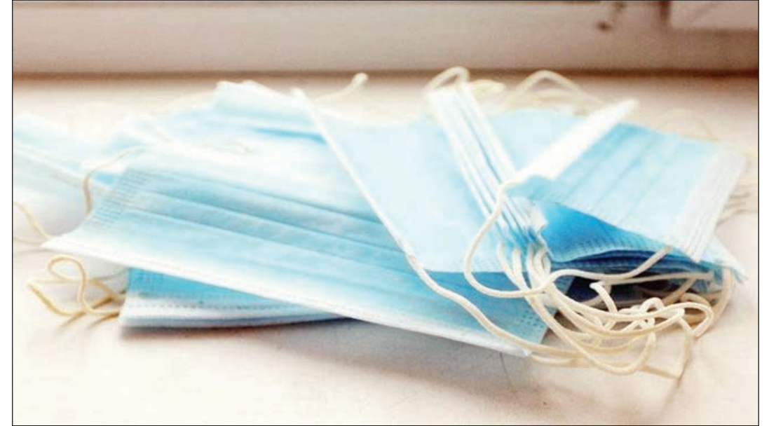
Əvvəlki 1-ci səh.

Maskalardan istifadə etməmək, sosial məsafəni qorunmaq ölkəmizdə koronavirusa yoluxmanı qarşısını almaz edə bilər