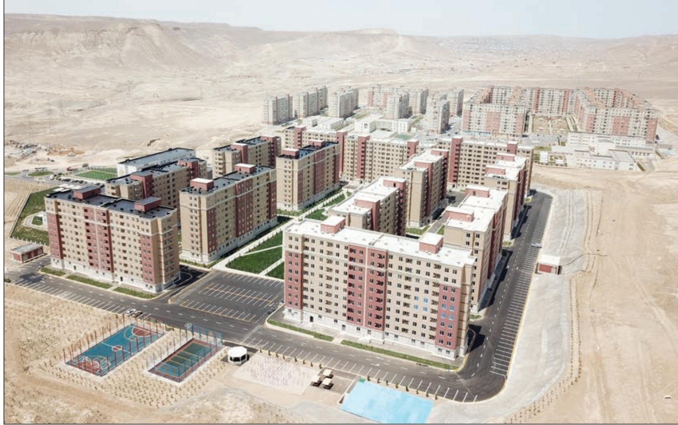
Əvvəlki 1-ci səh.

Prezident global pandemiya ilə mübarizə dövründə də xoşməramlı missiyasını davam etdirərək daha 1336 məcburi köçkün ailəsinə sevinc bəxş etdi