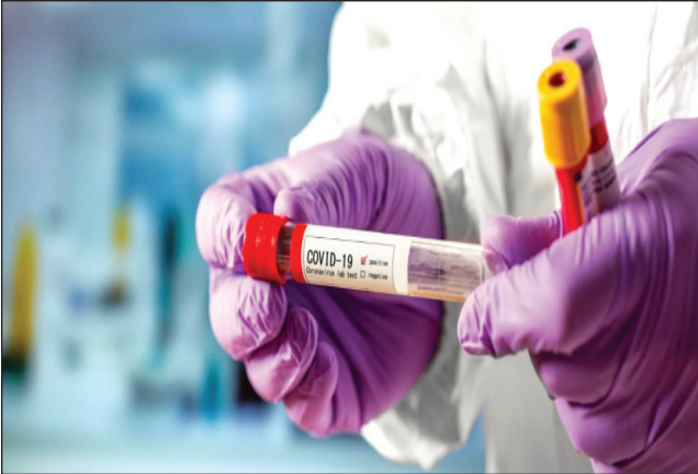
Dünyanın koronavirus mənzərəsi

Təhsil Nazirliyinin birbaşa tabeliyində fəaliyyət göstərən məktəbdənkar