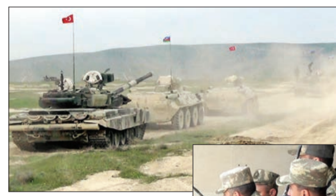
nın yüksək səviyyədə saxlanılmasıdır. Birgə təlimə iki ölkə ordularının şəxsi heyəti, zirehli texnikası, artilleriya qurğuları və mina-

Müdafiə Nazirliyinin mətbuat xidmətindən AZƏRTAC-a bildirilib ki, təlimin əsas məqsədi qərargahların müştərək planlarının hazırlanması, şəxsi heyətin döyüş hazırlığı səviyyəsinin artırılması və onların birgə əməliyyatları icra etmək vəzifələrinin inkişaf etdirilməsi ilə Azərbaycan və Türkiyə hərbi bölmələrinin qarşılıqlı fəaliyyətinin koordinasiyasına nail olunması, həmçinin təcrübə mübadiləsi həyata keçirməklə iki ölkənin hərbi qulluqçularının qarşılıqlı münasibətlərinin və qarşılıqlı anlaşılmasının