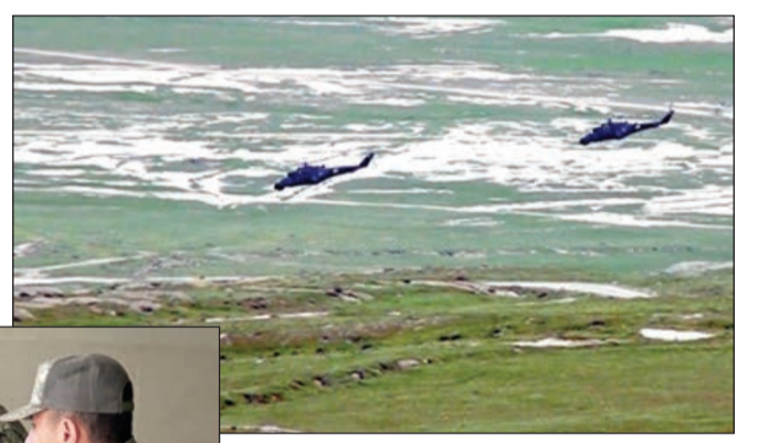
atanları, Hərbi Hava Qüvvələrinin döyüş və nəqliyyat helikopterləri, həmçinin hava hücumundan müdafiə və zənit-raket bölmələrinin cəlb edilib. Təlim mayın 3-dək davam edəcək.