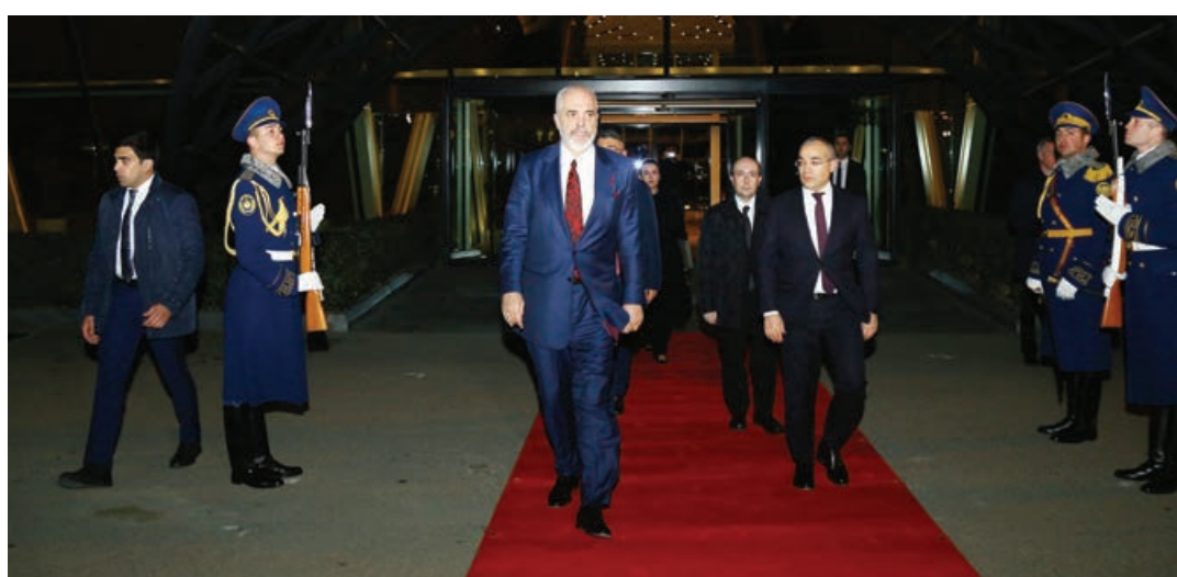
Albaniya Respublikasının Baş naziri Edi Ramanın Azərbaycan Respublikasına işgüzar səfəri martın 1-də başa çatıb.

AZƏRTAC xəbər verir ki, hər iki ölkənin dövlət bayraqlarının dalğalandığı Heydər Əliyev Beynəlxalq Aeroportunda Baş nazir Edi Ramanın şəərəfinə fəxri qarovul dəstəsi düzülüşdü.