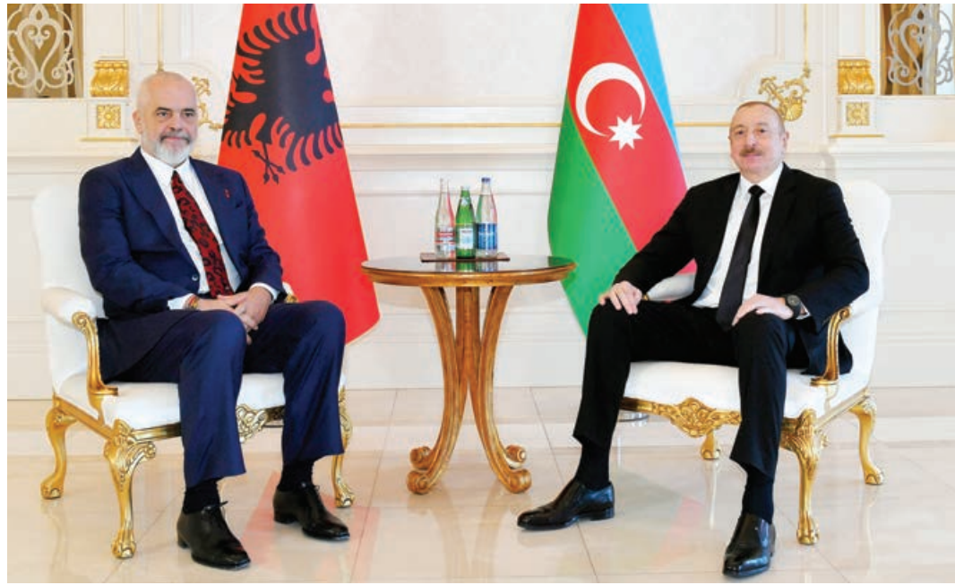
Prezident İlham Əliyevin Albaniyaya dövlət səfəri və

Görüşdə ikitərəfli münasibətlərə toxunuldu.