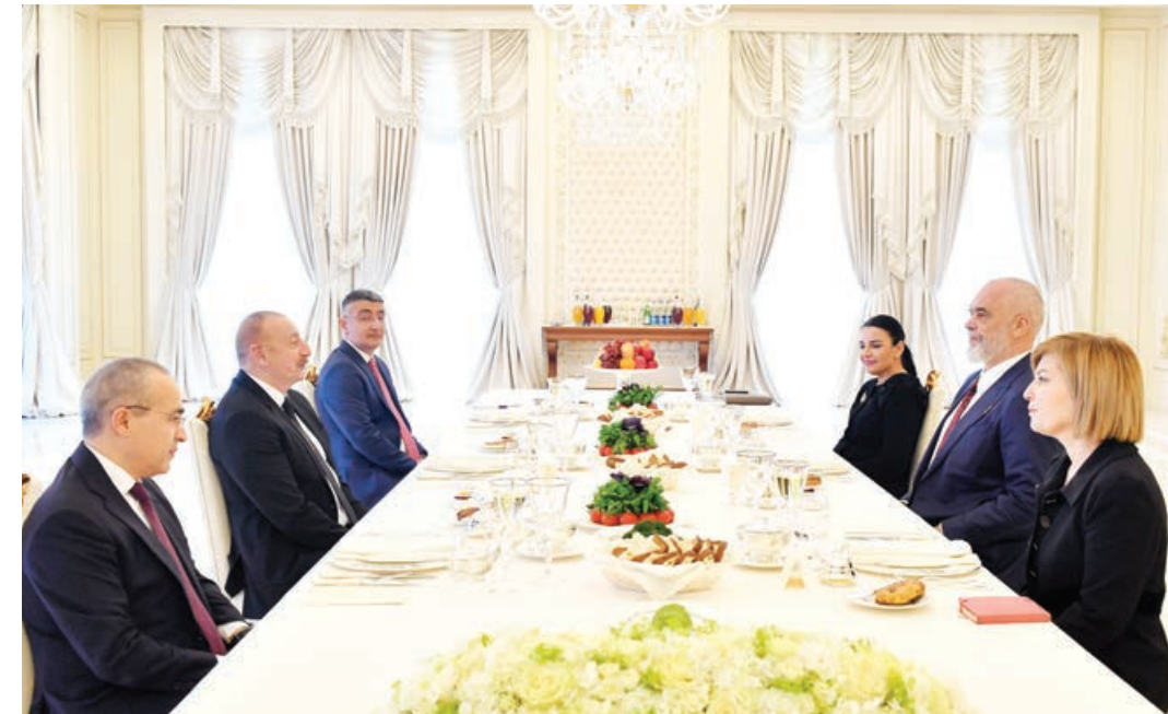
Martın 1-də Azərbaycan Respublikasının Prezidenti İlham Əliyevin Albaniya Respublikası

Prezident İlham Əliyevin Albaniyanın Baş naziri ilə geniş tərkibdə görüşü