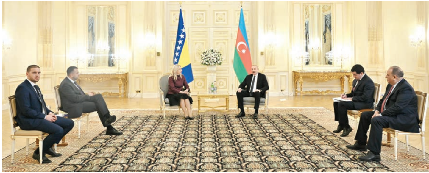
Əvvəli 1-ci sah.

AZƏRTAC xəbər verir ki, dövlətimizin başçısı Qoşulmama Hərəkatının COVID-19-a qarşı mübarizə üzrə Təmas Qrupunun Zirvə görüşündə iştirak etmək üçün ölkəmizə səfər etdiyinə görə Bosniya və Herseqovinanın Rəyasət Heyətinin Sədrinə minnətdarlığını bildirdi, səfər zamanı ikitərəfli əlaqələrimizlə bağlı müzakirələr aparmaq üçün imkanların da yarandığını dedi.