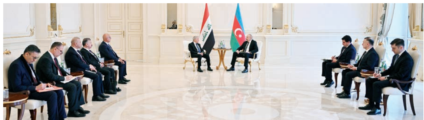
Əvvəli 1-ci sah.

Bərpaolunan enerji sahəsində Birləşmiş Ərəb Əmirliklərinin "Masdar" şirkətinin ölkəmizdə həyata keçirdiyi layihənin əhəmiyyəti vurğulandı. Turizm sahəsində əməkdaşlığın inkişaf etdiyini bildirilərək, qarşılıqlı turist səfərlərinin artmasının insanlar arasında təmaslara xidmət etdiyi qeyd olundu.