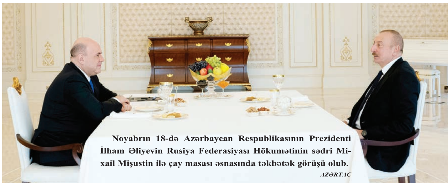
Noyabrın 18-də Azərbaycan Respublikasının Prezidenti İlham Əliyevin Rusiya Federasiyası Hökumətinin sədri Mixail Mişustin ilə çay masası əsnasında təkbətək görüşü olub.