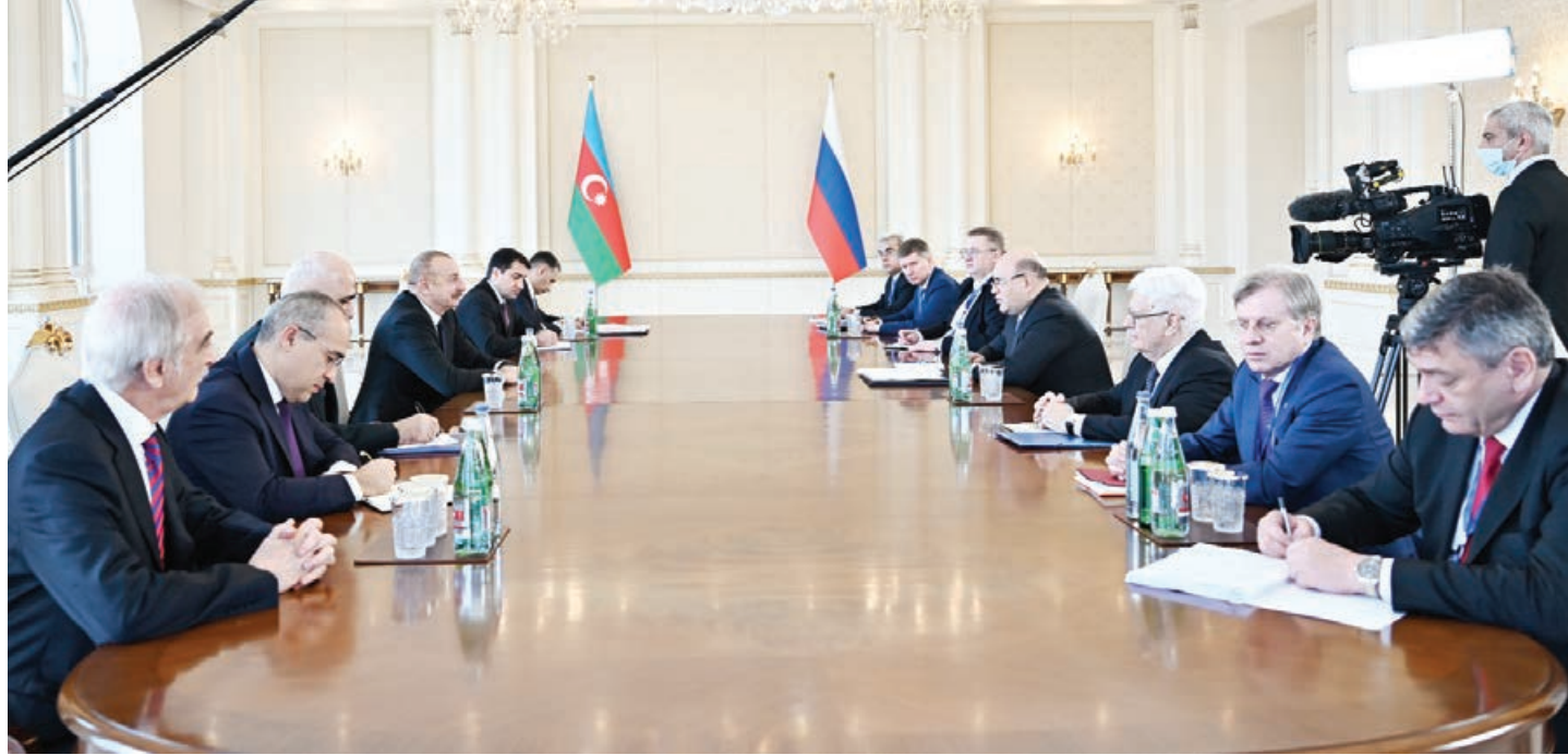
Əvvəli 1-ci sahə.

Həmçinin tranzit-logistika infrastrukturunu məsələsində, ilk növbədə iktirafı əsasda və əlbəttə, qonşu ölkələr də cəlb edilməklə qarşılıqlı əməkdaşlıq potensialını artıracaqdır. Ona görə ki, Rusiya və Azərbaycan uzun illər boyu ölkələrimizdə nəqliyyat-logistika infrastrukturuna fəal surətdə sərmayə qoyublar. Nəqliyyat dəhlizlərinin, ilk növbədə "Şimal-Cənub" dəhlizinin potensialının artırılması və layihədə iştirak edən bütün ölkələrin maraqlarına uyğun olacaq, o cümlədən biznes üçün əlavə perspektivlər açacaq.