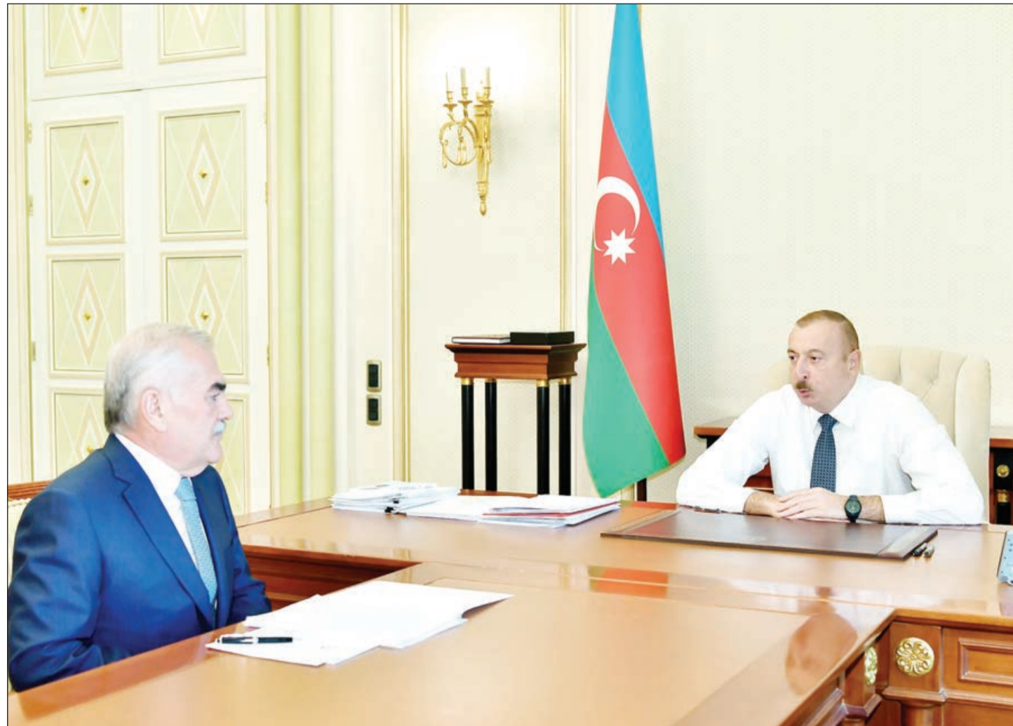
Əvvəli 1-ci səh.

Bu günlər sərhədlərdə məhəlli münaqişələr baş verir, ancaq buna baxmayaraq, Sizin rəhbərliyinizlə, qaygınızla muxtar respublikada yerləşən Azərbaycan Respublikası Silahlı Qüvvələrinin birləşmə və hissələrinin uğurlu yol keçib, Əlahiddə Ümumqoşun Ordusu korpusundan Əlahiddə Ümumqoşun Ordusuna qədər yol keçibdir. Bu da Sizin qaygınızla yaradılıb. Alınmış silah-sursatla bu gün muxtar respublikanın ordusu da lazımcına təmin olunur. Hazırda muxtar respublikada yerləşən birləşmə və hissələrdə qəbul edilmiş planlara uyğun olaraq təlimlər və nəzəri işlər həyata keçirilir. Eyni zamanda, hazırda muxtar respublikanın əsgəri məişət komplekslərinin yaxşılaşdırılması sahəsində işlər gedir, hava hücumundan müdafiə sahəsində işlər həyata keçirilir. Bir sözlə, Sizin qaygınızla muxtar respublikanın müdafiəsi üçün orada yerləşən hərbi hissələr hər bir tapşırığı yerinə yetirməyə tam hazırdır.