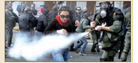
Təhsil Nazirliyinin hazırladığı müvafiq qanun layihəsinə qarşı çıxırdılar.

Müəllimlər bir neçə aylıq müvəqqəti əmək müqavilələri ilə işə götürülənlərin daimi müqavilə ilə işə qəbul olunmasını tələb edirdilər. Pedaqoqlar