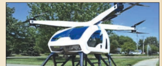
idarəetməni coystiklə (kompüter üçün oyun çubuğu) həyata keçirir. Təyyarədə yüksəkliyi, külliyin sürətini və istiqamətini nəzərə alaraq lazım olan enerjiyi tənzimləyən cihaz da var. Bataryanın boşalması zamanı isə əməliyyat sistemi avtomatik işə düşərək yere eniş təmin edir.

Dronlarda olduğu kimi, bu uçuş aparatının sabitliyi də kompüterlə təmin olunur, pilot isə