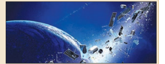
yan peyklər, habelə uçuş zamanı qopmuş fraqmentlər zibilləyir.

Ən çox kosmik zibil orbital aparatların dağılması və toqquşması nəticəsində əmələ gəlir. Bundan əlavə, orbit raketlərin işləmiş mərhələləri və daşıyıcı blokları, artıq fəaliyyətdə olma-