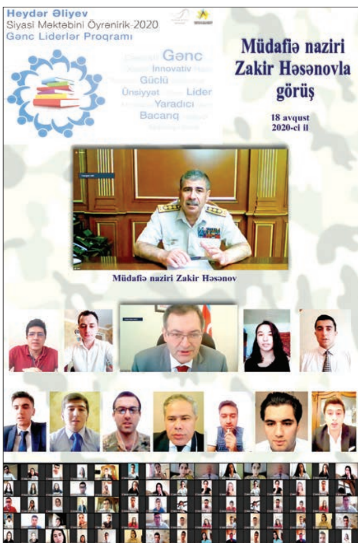
Müdafiə naziri Zakir Həsənov gənclərlə görüşür.

Sonra nazir Zakir Həsənov gənclərin Tovuz döyüşləri, Azərbaycanın ordu quruculuğu, Azərbaycan-Türkiyə birgə hərbi təlimləri və di-