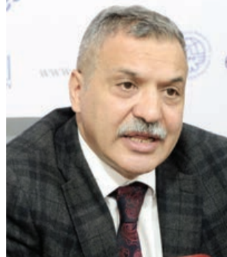
Ermənistan ətraf mühitə və insanların sağlamlığına ziyan vurur

Azərbaycanda fəaliyyət göstərən vətəndaş cəmiyyəti təşkilatları Ermənistanın dağ-mədən sənayesinin ekoloji fəlakətə səbəb olan fəaliyyəti barədə beynəlxalq ictimaiyyətə və Birləşmiş Millətlər Təşkilatına (BMT) müraciət ünvanlayıblar. Müraciətdə qeyd olunub ki, Ermənistanın Azərbaycanla sərhəd bölgəsində davam edən mədən əməliyyatları ekosistemə ciddi ziyan vurur. Bu ekoloji təsir insanların sağlamlığına, flora, faunaya, torpağa, havaya və suya ciddi təhlükə yaradır. Mövzu ilə bağlı məktub ünvanlayan ictimai birliklərin nümayəndələrinin fikirlərini öyrəndik. Onların sözlərinə görə, BMT və bir sıra digər beynəlxalq və regional təşkilatlar Ermənistanı yaradığı ekoloji problemlərin aradan qaldırılması üçün təsir göstərə bilərlər.