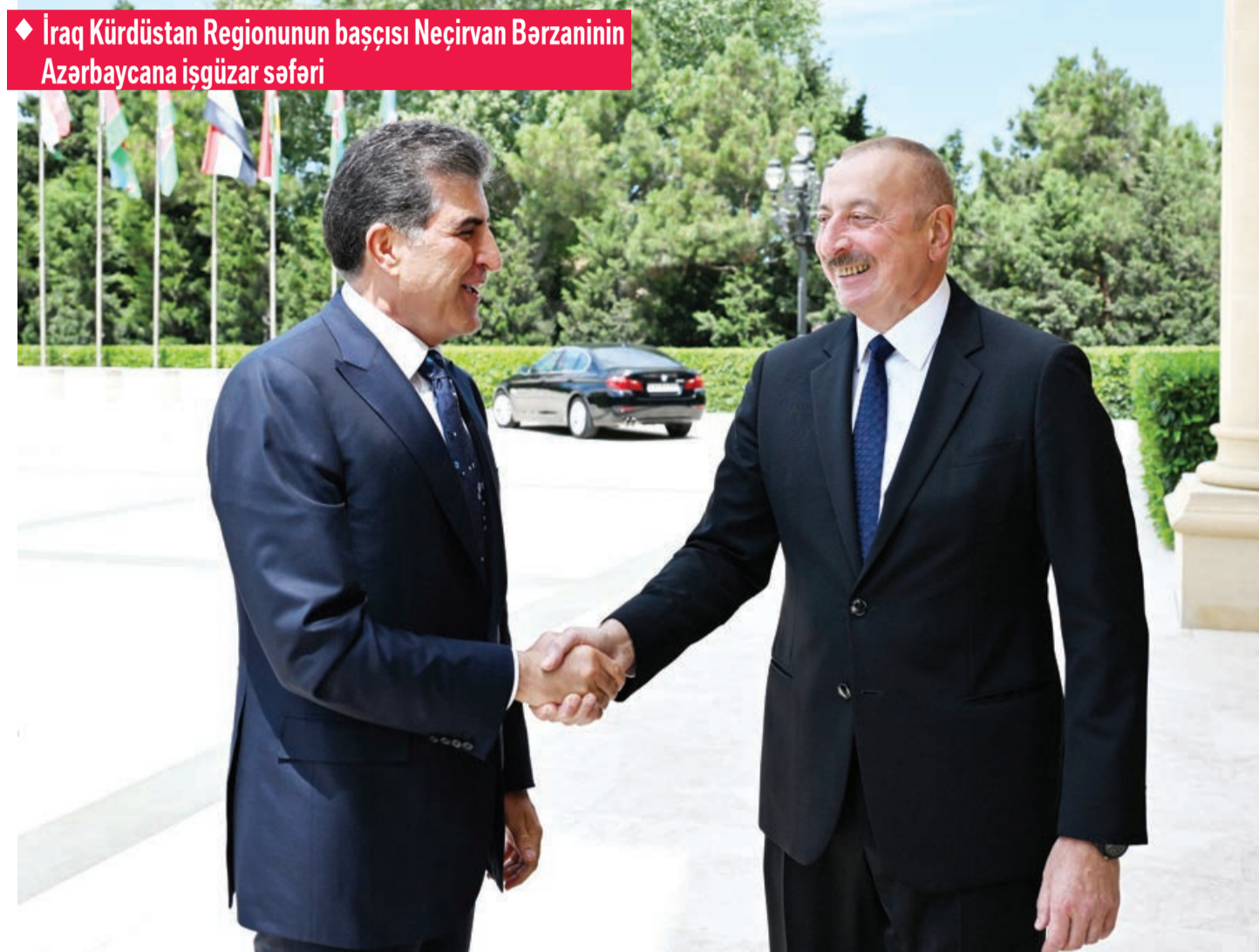
İraq Kürdüstan Regionunun başçısı Neçirvan Bərzaninin Azərbaycana işgüzar səfəri