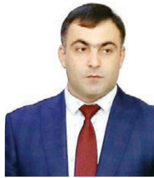
Bədnam qonşumuz aldığı qrantlardan təbiətin məhv edilməsi üçün istifadə edir