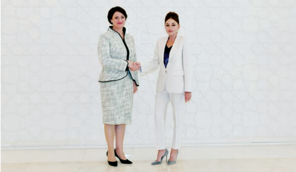
Mayın 18-də Azərbaycan Respublikasının birinci xanımı Mehriban Əliyevanın Litva Respublikasının birinci xanımı Diana Nausediene ilə görüşü olub.

Azərbaycanın və Litvanın birinci xanımlarının görüşü olub