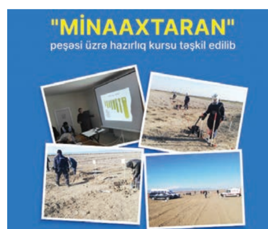
Əmək fəaliyyətinə başlayacaqlar. Müdaximlərdə tədris müddətində minimum əməkhaqqı məbləğində təqaüd də ödəniləcək.

Tədris müddəti bitdikdən və imtahanları uğurla başa vurduqdan sonra həmin şəxslər işğaldan azad olunan məntəzəqlərdə ərazilərin minalarında təmizlənməsi sahəsi üzrə