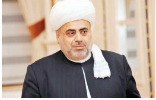
Qafqaz Müsəlmanları İdarəsinin (QMİ) sədri Şeyxülislam Allahşükür Paşazadə Novruz bayramı münasibətilə Azərbaycan xalqını təbrik edib.

QMİ-nin Mətbuat xidmətindən AZƏRTAC-a bildiriblər ki, təbrikdə Şeyxülislam xalqımızı qədim, mübarək Novruz bayramı münasibətilə ürəkden təbrik edib, Allah-taaladan səadət və rifah, xoş əhvali-ruhiyyə və bayram sevinci diləyib. Qeyd edib ki, Novruz Azərbaycan xalqının çoxəsrlik tarixində özəl yeri və milli önəmi olan bayramlarından biridir. Min illər boyu qeyd edilən mübarək Novruz torpağın oyanışını, təbiətin yenilənməsini və bəşərin itibahını təcəssüm etdirir. Yaşadığımız hər an, varlığımız üçün Uca Yaradana həmd-səna edən xalqımız Novruz Allahın böyük lütfü kimi dəyərləndirir. Novruz bayramı Ulu Yaradan tərəfindən xalq olunmuşların ən alisi olan insanın ruhuna təbiətlə vəhdətdə təkamül, oyanış səadəti yaşadır.