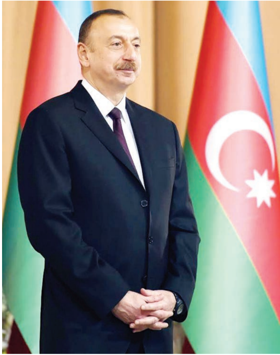
Əvvəlki 1-ci səh.

Ötən il Azərbaycanda, əsasən 3 istiqamətdə - işğaldan azad olunmuş ərazilərin bərpa-quruculuq prosesi, pandemiyanın iqtisadiyyatda yaratdığı fəsadların aradan qaldırılması, global ərzaq qıtlığı və bahalaşmaya qarşı mübarizə ilə bağlı tədbirlər həyata keçirilib və xeyli uğurlar əldə edilib. 2021-ci ildə də İlham Əliyevin həyata keçirdiyi məqsədyönlü siyasət nəticəsində ölkəmizdə sosial-iqtisadi inkişaf dinamikası davam edib. Rəqəbatqabiliyyəti milli iqtisadiyyatın formalaşdırılması, dayanıqlı iqtisadi artımın sürətləndirilməsi, inkişafdan hər bir vətəndaşın bəhrələnməsi, işğaldan azad olunmuş ərazilərə əhalinin qayıdışının təmin edilməsi məqsədilə Prezident tərəfindən "Azərbaycan 2030: sosial-iqtisadi inkişaf dair Milli Prioritetlər" in təsdiq edilməsi haqqında sərəncam imzalanıb. Sərəncamın icrasının təmin edilməsi və "2022-2026-cı illərdə sosial-iqtisadi inkişaf Strategiyası"nın hazırlanması məqsədilə Nazirlər Kabineti tərəfindən 5 Milli Prioriteti əhatə edən 10 alt işçi qrupu yaradılıb.